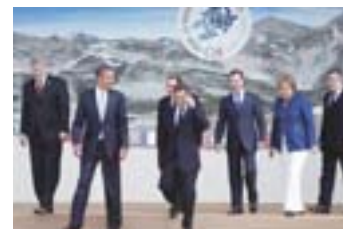
Des membres du G8, en Italie, en 2009.

Remplacé officiellement par le G20 l'an passé, le G8 n'est pas mort. Comme au bon vieux temps, les dirigeants de la France, de l'Allemagne, de la Grande-Bretagne, de l'Italie, des Etats-Unis, du Japon et de la Russie se réunissent aujourd'hui en petit comité, accueillis par le Premier ministre canadien, Stephen Harper, à Huntsville, dans l'Ontario. Angela Merkel et Nicolas Sarkozy plaideront pour la mise en place d'une taxation financière sur les banques, ainsi que sur les