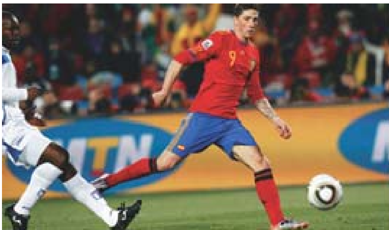
L'attaquant de la Roja Fernando Torres.

Avec la Suisse sur ses talons, c'est une véritable finale que l'Espagne va disputer ce soir (20h30), à Pretoria, face au Chili. Si la Roja l'emporte, Vicente del Bosque et ses hommes poursuivront l'aventure, quel que soit le score dans l'autre match entre la «Nati» et le Honduras. Pour cela, le sélectionneur espagnol, qui a stigmatisé le manque de finition de ses joueurs face aux Honduriens (2-0), sait qu'il faudra être beaucoup plus efficace face à de séduisants Chiliens qui ont encore besoin d'un point pour valider leur billet en 8e de finale: «Nous n'avons pas bien joué. Nous avons eu beaucoup d'occasions et nous aurions dû l'emporter par un écart plus important». Pour Xavi, c'est clair, «il faudra être plus agressif devant le but». Après leur défaite face à la Suisse dès le premier match (1-0), les champions