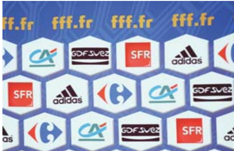
Les «top sponsors» des Bleus ont versé jusqu'à 2,5 millions d'euros pour le Mondial.

L s'expliquer avec leurs fans... et leurs sponsors. Rentrée hier d'Afrique du Sud, où elle s'est couverte de ridicule, l'équipe de France a mis dans l'embarras les grands groupes qui avaient payé pour associer leur image à son épopée, soit entre 250000 et 2,5 millions d'euros pour les «top sponsors». «Les marques veulent s'associer à des valeurs positives : solidarité, respect, entraide... tout le contraire de ce qui s'est exprimé le week-end dernier», analyse Gilles Portelle, DG de Havas Sports. Conséquence immédiate: plusieurs opérations commerciales et campagnes publicitaires mettant en avant les Bleus ont dû être interrompues.