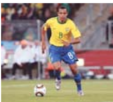
Le Brésilien Gilberto Silva.

Comme prévu, Portugal-Bราซิล, cet après-midi (16h) à Durban, sera le grand choc de la première phase. Un duel entre cousins éloignés, dont l'enjeu sera avant tout la première place du groupe G. Car, si le Portugal n'a